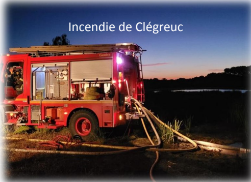
Incendie de Clégreuc

En cette rentrée, les activités sportives se trouvent également impactées puisque nos terrains ont beaucoup souffert du rationnement, des travaux sont envisagés sur l'un d'eux, empêchant son utilisation à l'automne.